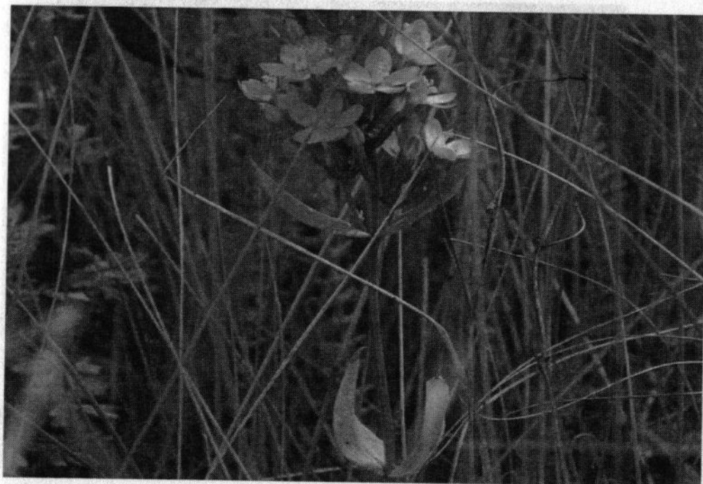
Рис. 7. Смілка південнобузька ( Silene hyrpanica )

У урочищах села Велика Севастянівка знайдено 5 екземплярів смілки південнобузької ( Silene hyrpanica Klok) (занесено до Європейського Червоного списку) на території, площею 100 м 2 .