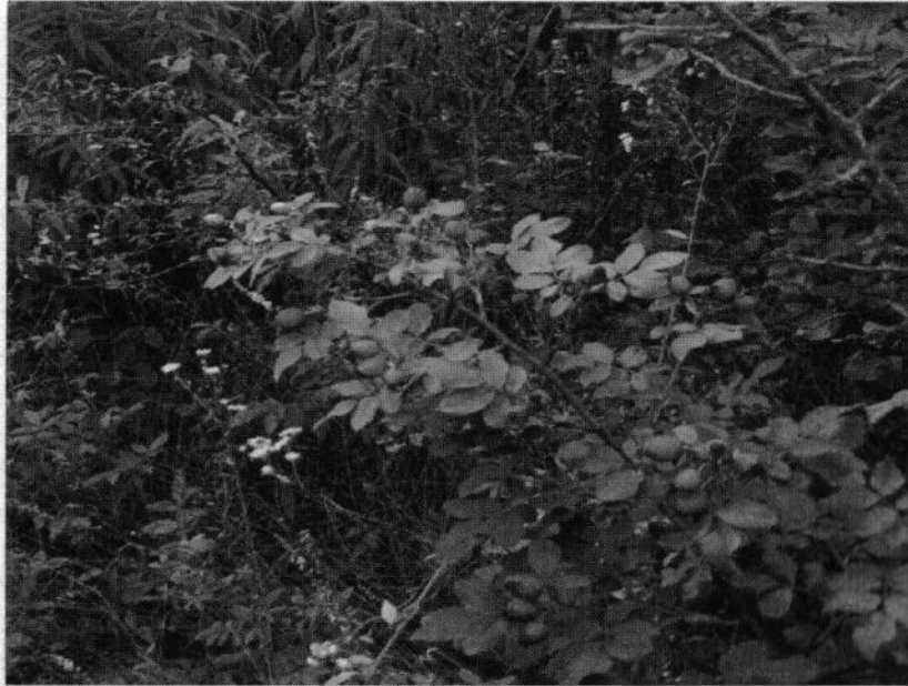
Рис. 5. Підлісок мішаного лісу масиву «Мала Березина»

Найвищі ділянки урочища – це глинисті та піщані обриви на яких зростають: чебрець звичайний ( Thymus serpyllum ), костриця овеча ( Festuca ovina ), нечуй-вітер волохатенький ( Hieracium pilosella ), щавель горобиний ( Rumex acetosella ), агарлик трава ( Jasione montana ), чаполоч запашна ( Hierochloa odorata ), звіробій звичайний ( Hypericum perforatum ), цмин пісковий ( Helichrysum arenarium ), шавлія лікарська ( Salvia officinalis ) чисельність яких різко зменшується, замінюючись бур'янами.