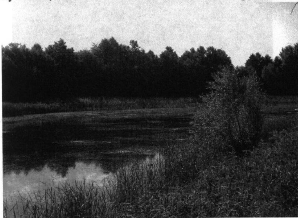
Рис. 3. Ставок Цимбалів

Рельєф строкатий, ускладнений мережею яружно-балкової системи. Характерний нерівномірним заляганням ґрунтових вод. Ґрунтовий покрив представлений дерново-підзолистими, сірими лісовими, дерново-лучними, піщано-глиняними та болотними ґрунтами.