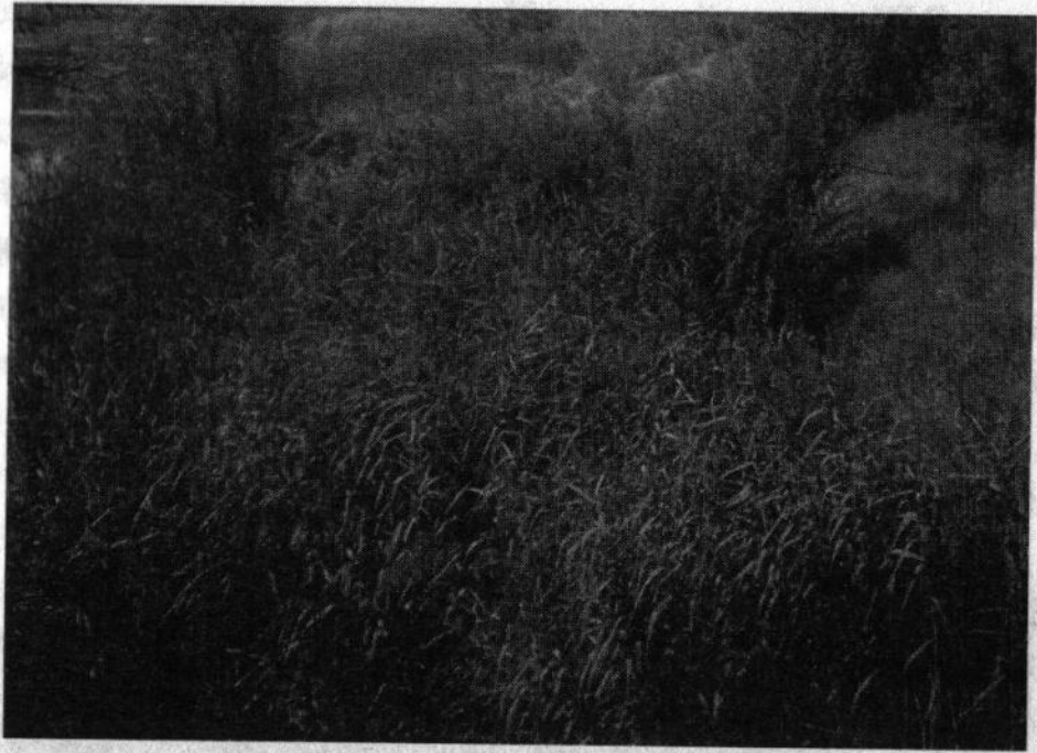
Рис. 4. Заболочена територія Ракового ставка

У підвищеній частині «Ракова левада» плавно переходить у лісовий масив «Мала Березина», який представлений сосново-дубовим угрупованням, другий ярус якого займає дика яблуня ( Malus silvestris ), алича ( Prunus cerasifera ), глід ( Crataegus ), черешня ( Prunus avium ), акація біла ( Robinia pseudoacacia ); чагарниковий ярус представлений бузиною червоною ( Sambucus racemosa ) та чорною ( Sambucus nigra ), шипшиною ( Rosa canina ), айвою ( Cydonia ); трав'яний ярус представлений злаками, материнкою звичайною ( Origanum vulgare ), звіробоем ( Hypericum perforatum ), анемоною лісовою ( Anemone sylvestris ), парилом звичайним ( Agrimonia eupatoria ), первоцвітом весняним ( Primula veris ), і найчисельнішою кількістю лісових суниць ( Fragaria vesca ).