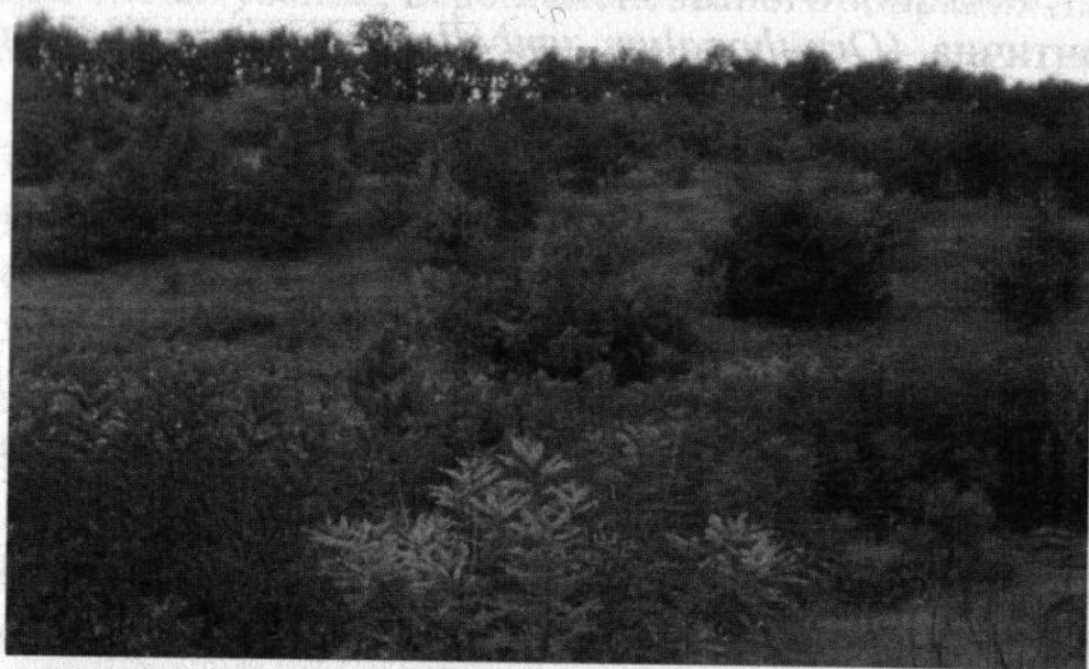
Рис. 2. Біорізноманіття урочища «Ракова левада»

Потенційними природоохоронними територіями Христинівського району є урочище «Ракова левада» розташоване в околицях с. Велика Севастянівка.