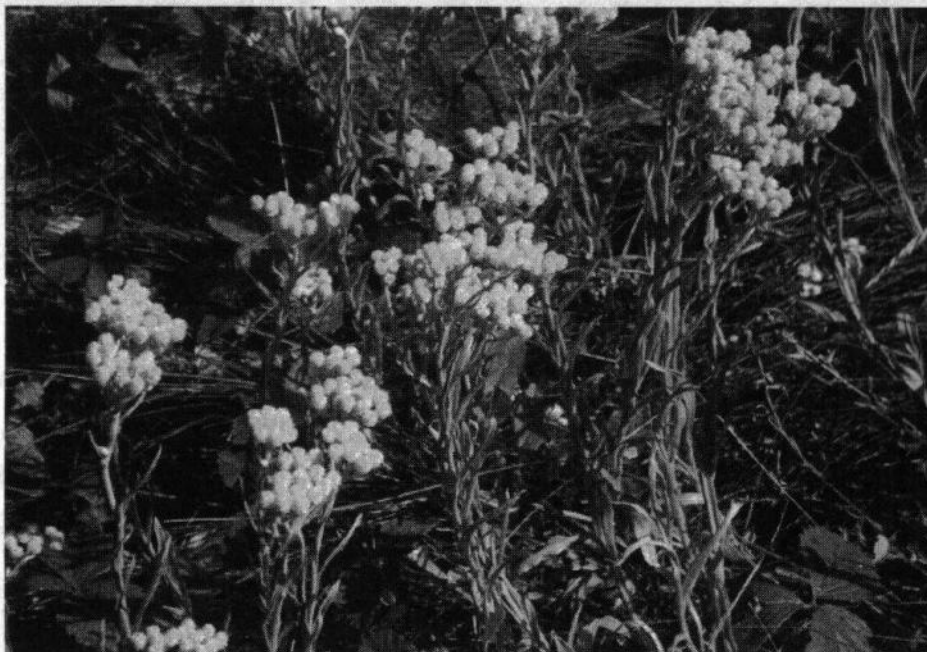
Рис. 6. Цмин пісковий ( Helichrysum arenarium )

На цих ділянках випасають худобу, збирають лікарські рослини, вирубують дерева — це і є основною причиною зміни природних угруповань.