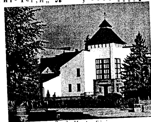
Рис.3. Музей «Бойівщина»

ПРОПОНУЮЧИ туристам екскурсш тур^ г. 1;Г"ьГйтР1«Г,и,, Л ТМ у * * * * « « - •