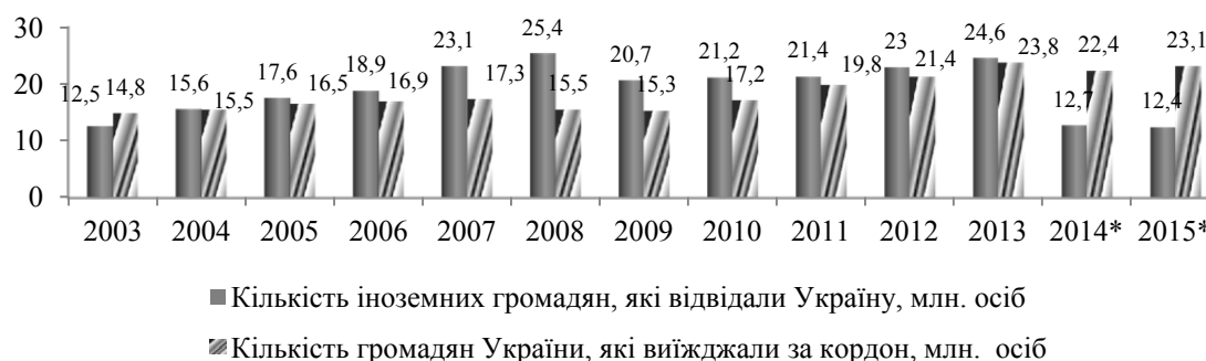
Рис. 2. Динаміка туристичних потоків в Україні у 2003-2015 рр.

Актуальними завданнями туристичної галузі є створення оптимальних нормативно-правових засад розвитку привабливого інвестиційного клімату, здатного збільшити обсяги капіталовкладень у туристичний та курортно-рекреаційний комплекс і його інфраструктуру. Аналіз туристичних потоків свідчить про динамічний розвиток туристичного бізнесу в Україні (рис. 2).