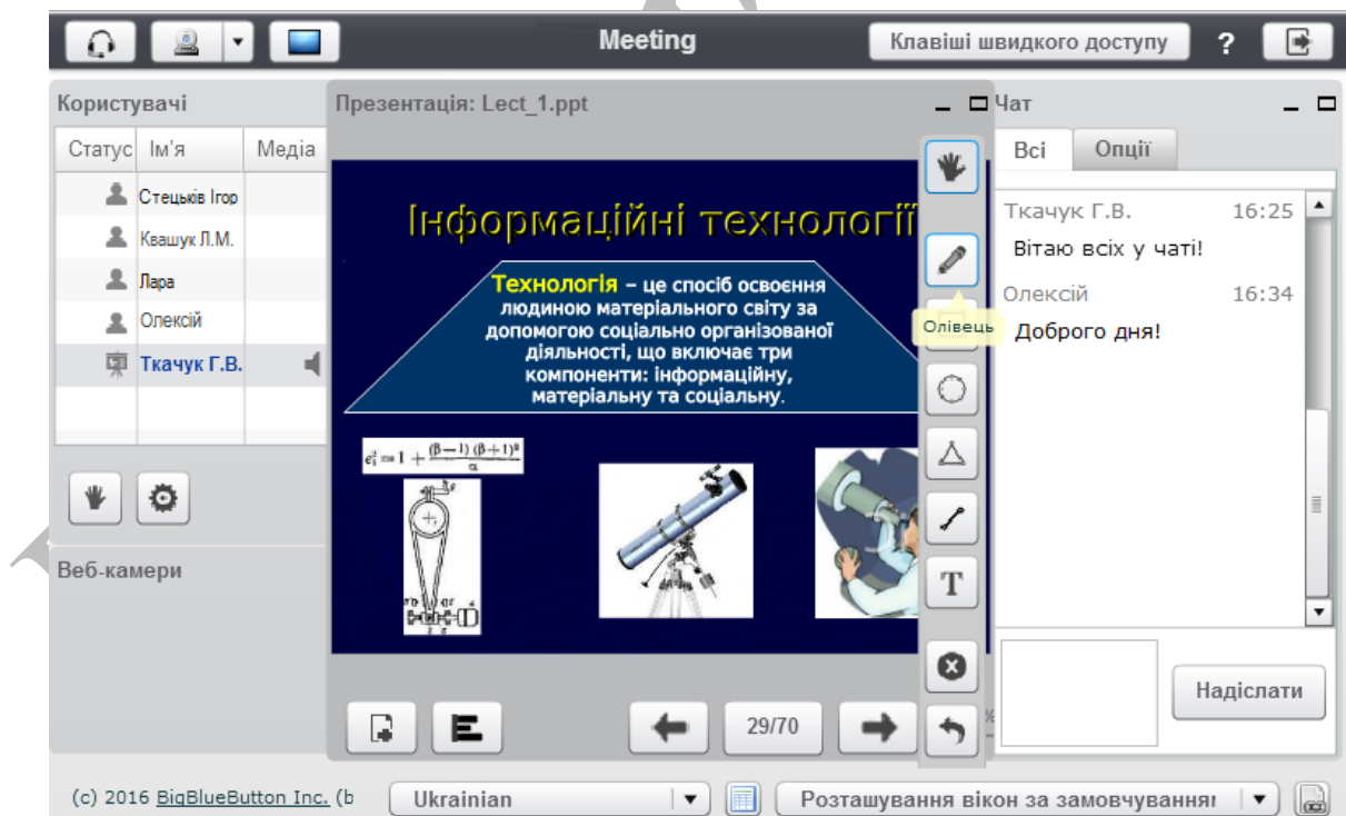
Рис.2. Інтерфейс BigBlueButton

Робота в BigBlueButton відбувається через браузер і не потребує від слухачів встановлення клієнтського забезпечення, що значно полегшує організацію вебінару (для входу у віртуальний клас користувачам достатньо перейти за посиланням).