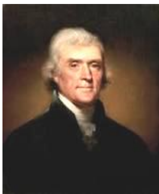
Томас Джефферсон (1743–1826 рр.) — учасник Першої американської революції, 3-й

Такий «спонтанний порядок», на думку Гі Нормана, спроможний забезпечити саморегулювання суспільного організму краще за будь-які державні плани.