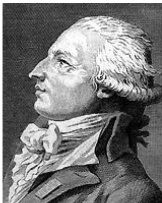
Антуан Луї Клод Дестюд де Трасі — видатний французький філософ, політик і економіст. Увів у науковий обіг термін «ідеологія».

Вийшов з в'язниці улітку 1794 р. після падіння Робесп'єра. За клопотанням Кабаніса, він став членом Академії моральних і політичних наук, заснованої у 1795 р.