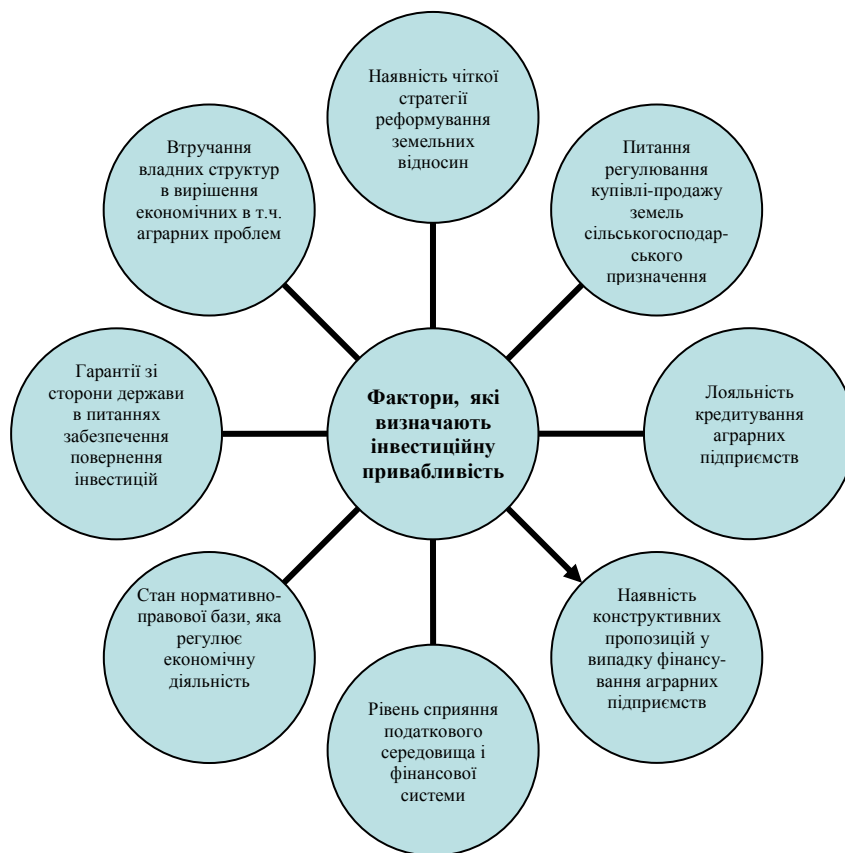
Рис. 1. Фактори, що визначають інвестиційну привабливість аграрних підприємств з боку державного регулювання

Визначаючи для себе інвестиційну привабливість аграрного підприємства, інвестор спирається на показники найбільш важливих чинників, що визначають інвестиційну привабливість аграрних підприємств з боку державного і регіонального впливу (рис.1.).