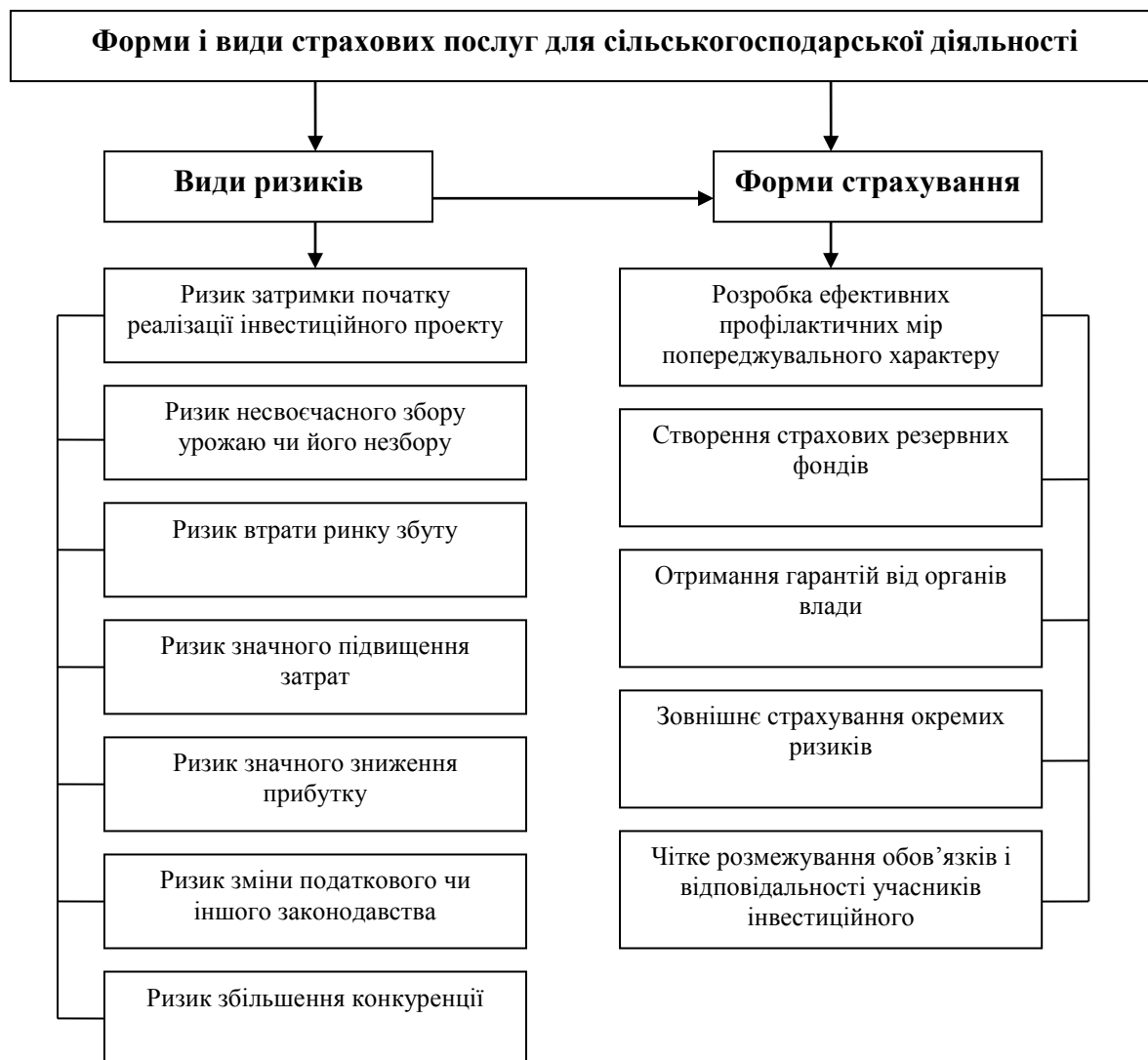
Рис. 2. Можливі форми і види обов'язкового страхування аграрної діяльності

створення державних резервів для забезпечення продовольчої безпеки і т.д.;