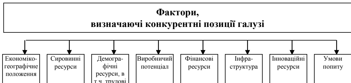
Рис. 3. Фактори, що визначають конкурентні позиції агропромислового комплексу (розроблено автором)

Найбільш важливі, на наш погляд, фактори, що визначають конкурентні позиції агропромислового комплексу представлені на рис. 3.