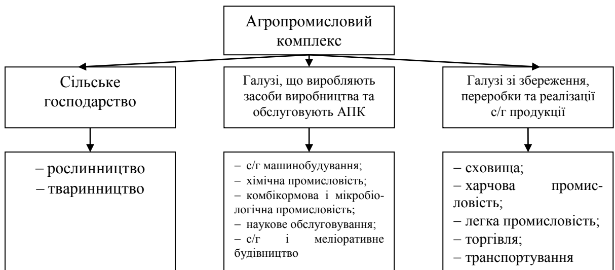
Рис. 1. Галузева структура агропромислового комплексу

Головною ланкою АПК є сільське господарство, яке охоплює рослинництво і тваринництво та створює сировинну базу для переробної промисловості. Другою ланкою є галузі, що виробляють засоби виробництва та обслуговують АПК —