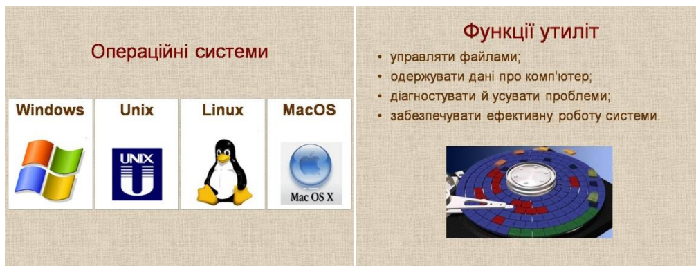
Рис.2. Зразки навчального матеріалу презентації

Окрему увагу доцільно звернути на пояснення матеріалу під час проведення вебінару, щоб показ слайдів не супроводжувався нудним читанням, а створювалась атмосфера реального спілкування. Тому потрібно передбачити в своїх поясненнях запитання до аудиторії. Це не тільки активізує студентів, але й дасть змогу зрозуміти хто розуміє і слухає лектора. Крім того, потрібно час від часу переглядати сторінку текстового чату, де можуть бути запитання від студентів.