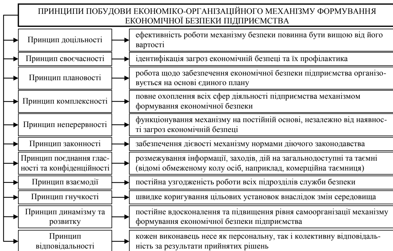
Рис. 1. Принципи побудови економіко-організаційного механізму формування економічної безпеки підприємств

Провівши аналіз наявних джерел наукової літератури, автор вважає, що основними принципами побудови економіко-організаційного механізму формування економічної безпеки підприємства виступають наступні (рис. 1).