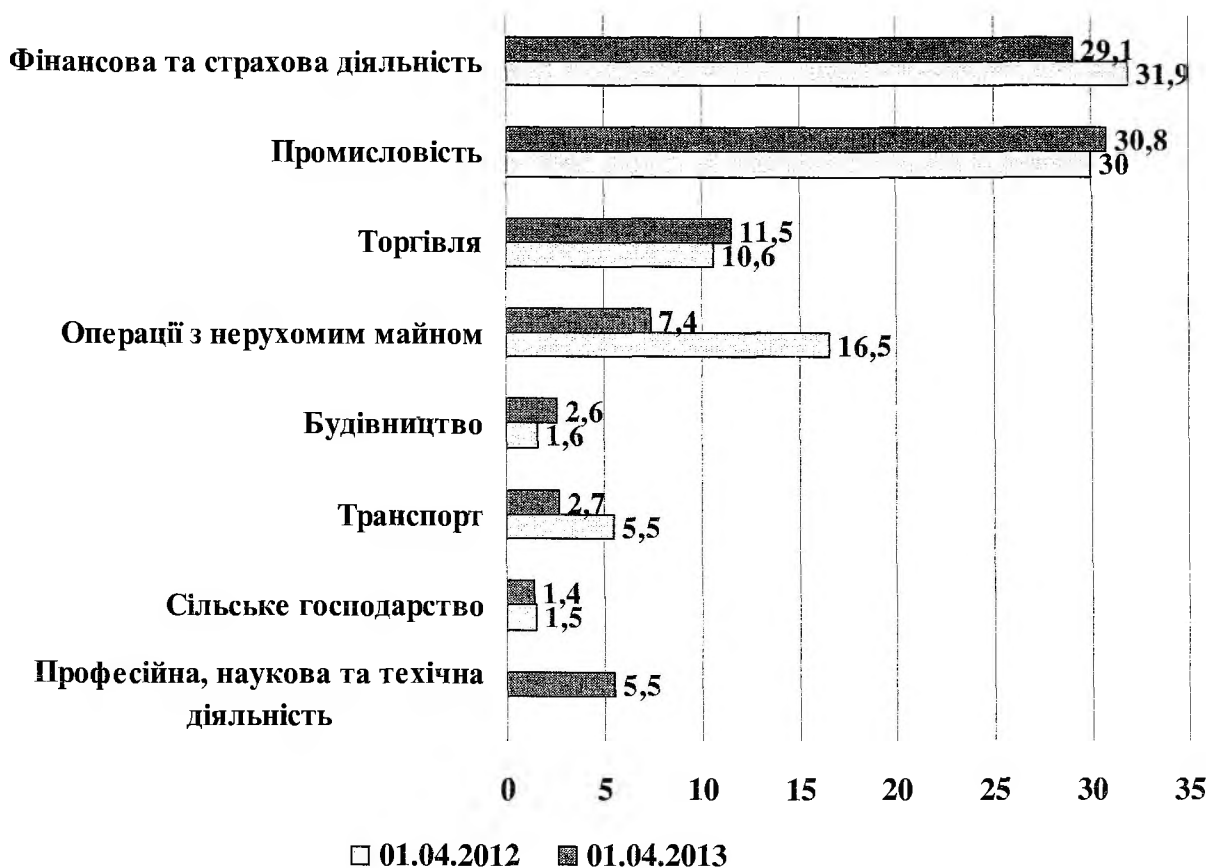
Рис. 3. Розподіл прямих іноземних інвестицій за основними видами економічної діяльності (у % до загального обсягу інвестування)