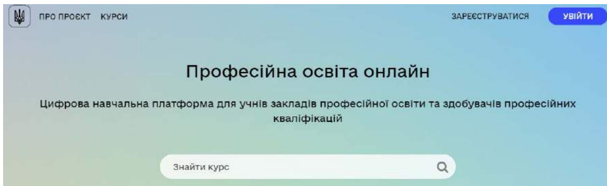
Рис. 1. Інтерфейс платформи «Професійна освіта онлайн» Джерело: [14]

Також важливо згадати проєкт EdUP, спонсорований Швейцарською агенцією з розвитку спільно з ТОВ «Геберіт Трейдинг» і Швейцарською фундацією технічного співробітництва з розвитку «Свісконтакт» [15]. Він розглядається як ініціатива, що суттєво впливає на сантехнічну освіту в Україні. Поділений на дві фази, проєкт дозволив створити навчально-практичні центри й розробити професійні стандарти під час першої фази, а друга фаза була спрямована на покращення якості освіти й розвиток співпраці з роботодавцями. У червні 2023 року друга фаза сильно змінила організаційну спроможність навчально-практичних центрів, розвинула співпрацю з бізнесом і створила можливості для професійного росту учасників освітнього процесу. Кампанія «Партнерство заради змін» обіцяє висвітлити успішні практики й усе різноманіття досвіду закладів-учасників проєкту, що охоплює новаторські методи менеджменту, ефективну комунікацію з учнями й вступниками, а також ефективне співробітництво з бізнес-середовищем. Сучасний інтерфейс і функціональні можливості платформи цікаві й корисні, а навігація сайту зрозуміла, що дозволяє вповні використовувати потенціал навчальних матеріалів (рис.2)