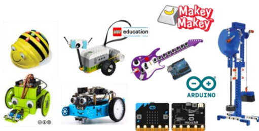
Рисунок 1 – Популярні робототехнічні набори

У концепцію Arduino не входять корпусні чи монтажні деталі (окрім попередньо підібраних «комплектів» для розробки одного чи кількох пристроїв). Розробник обирає метод установки й механічного захисту процесорних плат та компонентів розширення самостійно [2, 3].