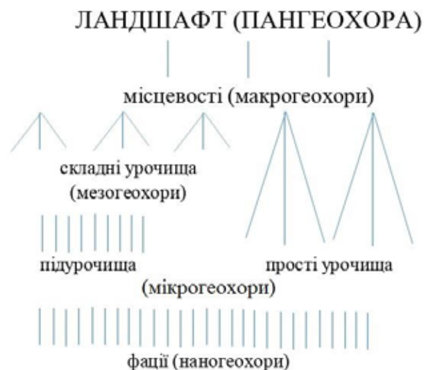
Рис. 1. Структура земного простору на субландшафтному рівні

В аналогічний спосіб формулюємо хоричні (просторові) відповідники на регіональному рівні горизонтальної диференціації ландшафтно оболонки Землі. Наголошуючи на нерозривному зв'язку між внутрішньоландшафтними та надландшафтними (тими, що складають класичну схему фізико-географічного районування) структурами, ми пропонуємо простір, зайнятий тим чи іншим індивідуальним ландшафтом, а також розташований над