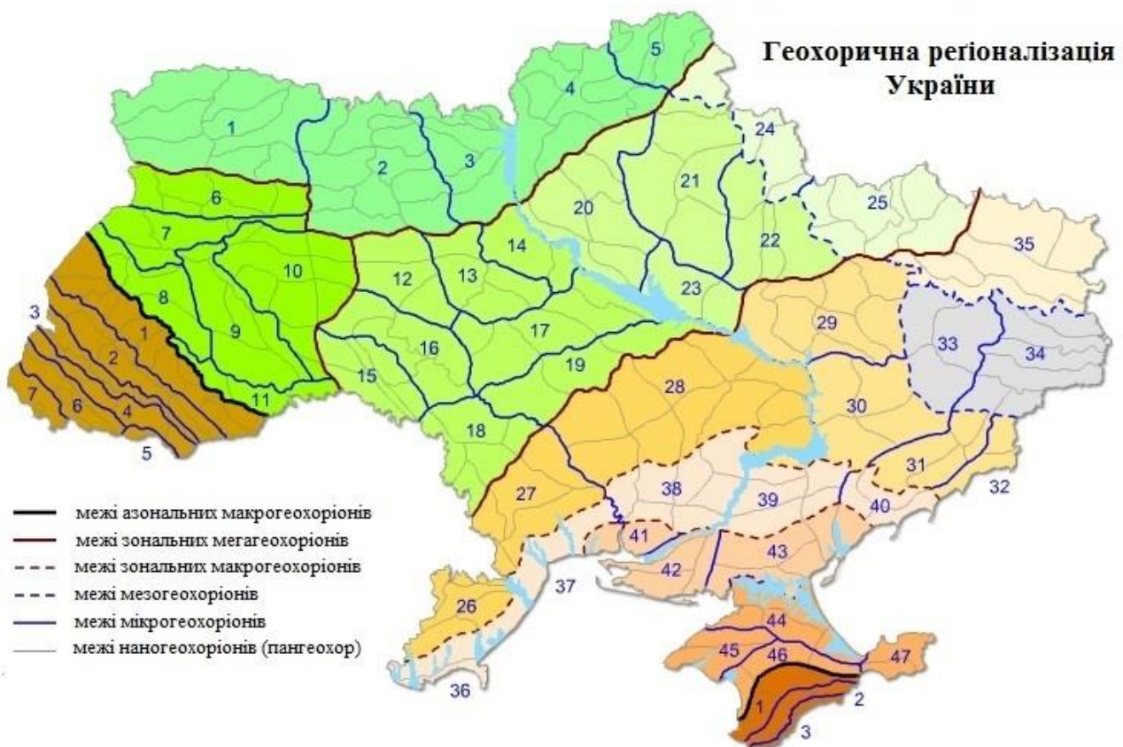
Рис. 3. Картохема геохоричного районування (регіоналізації) території України