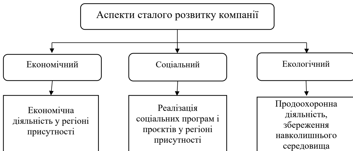
Рис. 1. Аспекти сталого розвитку компанії

Досягнення найбільших результатів у створенні суспільного блага за допомогою практик КСВ можливе за умови системного підходу до неї, що передбачає довгострокове планування, оцінку соціального ефекту і безперервну взаємодію з представниками місцевої громади. Більше того, поширення такого підходу в корпоративних практиках можливе тільки з поширенням концепції у всьому бізнес-співтоваристві, з підвищенням інформованості і розуміння підприємцями значущості і вигідності такої діяльності як для суспільства, так і для самої компанії [8].