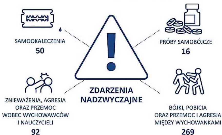
Rysunek nr 3. Liczba zdarzeń niepożądanych w kontrolowanych placówkach w latach 2012-2016.

jego niewielkiej budowy nie nadwyrężyło. Wpływ i działanie rzeczy zewnętrznych składają dużą część naszego życia.