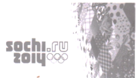
Фото 2. Логотип олімпіади в Сочі, Росія, 2014 р.