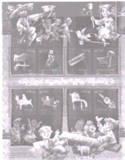
Фото 4. Харук Сергій, Харук Олександр. Поштова марка «Українська народна іграшка»