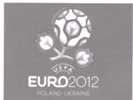
Фото 1. Логотип Чемпіонату Європи з футболу в Україні, 2012 р.

На важливій ролі національного орнаментального мистецтва як засобу навчання, виховання і розвитку особистості наголошували Є. Антонович, Ю. Афанасьєв, Г. Сотська, Б. Тимків, Л. Фірсова та інші вчені. У своїх педагогічних концепціях вони переконливо доводять, що археологічні артефакти з елементами національної орнаментики розкривають безмежне поле для розвитку креативності, творчої активності та розширення емоційно-почуттєвого світу людини. Однак вивчення теорії і практики фахової підготовки майбутніх дизайнерів-графіків у закладах вищої освіти виявило суперечність між вагомим дидактичним потенціалом національної орнаментики в художньо-творчому розвитку особистості та недостатньо розробленими теоретичними і практичними основами його реалізації.