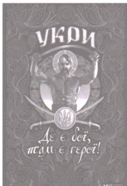
Фото 9. Дизайн патріотичного плаката «Україна. Де є бої, там є герої!»

стання регіонального орнаментального розпису з села Самчики (Старокостянтинівський район, Хмельницька обл.) у дизайні настінного перекидного календаря [2].