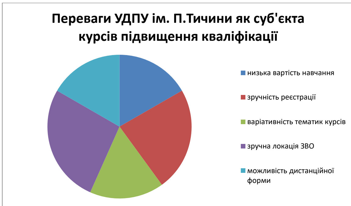
Рис. 1. Результат оцінювання переваг Уманського державного педагогічного університету як суб'єкта курсів підвищення кваліфікації.

Щодо обрання Уманського державного педагогічного університету імені Павла Тичини серед суб'єктів підвищення кваліфікації було відзначено кілька переваг ЗВО як то: зручне розташування ЗВО (27%), онлайн реєстрація (23%), низька вартість (17%), варіативність тематики курсів (17%), та дистанційна форма курсів (17%) (див. рис. 1).