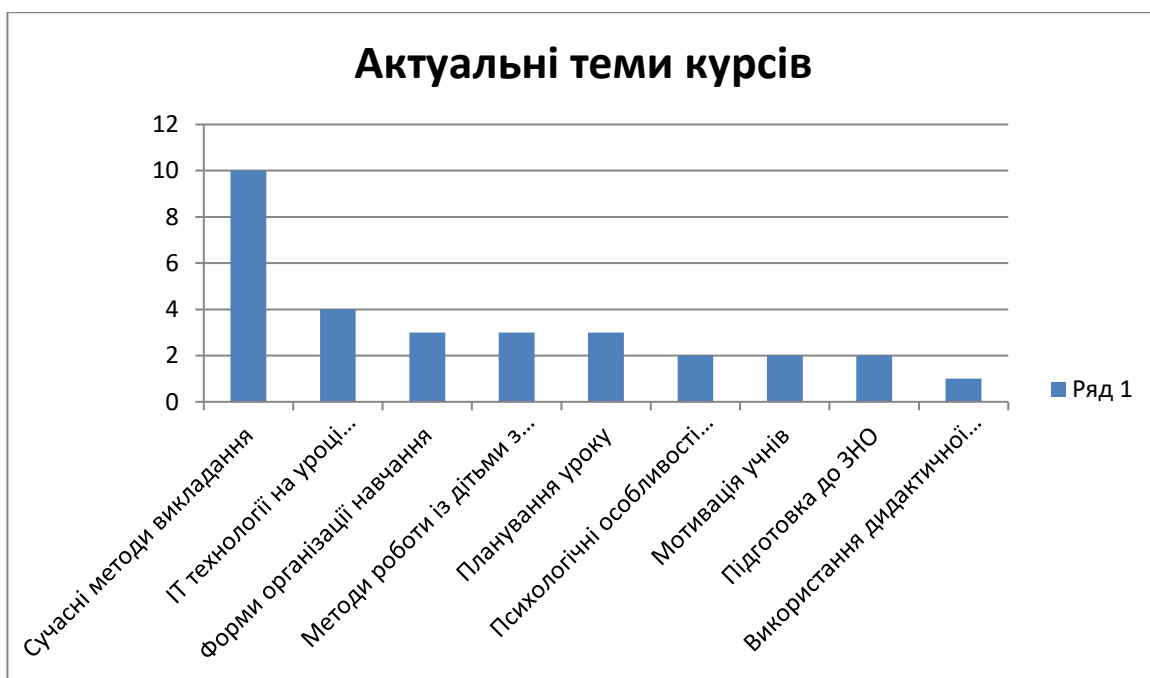
Рис. 5. Результат оцінювання актуальності тем курсів підвищення кваліфікації.

Учителями була означена потреба у формуванні професійної компетентності, у розумінні психологічних особливостей учнів різного шкільного віку, роботі із дітьми з особливими освітніми потребами, плануванні та організації уроків в очній та дистанційній формі, підготовці та використанні дидактичного матеріалу, підготовці учнів до ЗНО тощо (див. рис. 5).