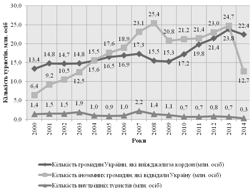
Рис.1. Динаміка туристських потоків в Україні за період 2000-2014 року (за матеріалами [2])

Виїзна статистика українців за кордон у 2014 р. демонструє спад порівняно з 2013 р. на 1,3 млн. осіб або на -5,6 %. Якщо говорити про топові позиції у рейтингу виїзних напрямків для українських туристів, то перші місця посіли Польща та Росія: 7,65 і 4,67 млн. українців відповідно відвідали ці країни. Бачимо, що Польща ще з 2012 р. за популярністю серед українських громадян випередила Російську Федерацію і посідає перше місце рейтингу.